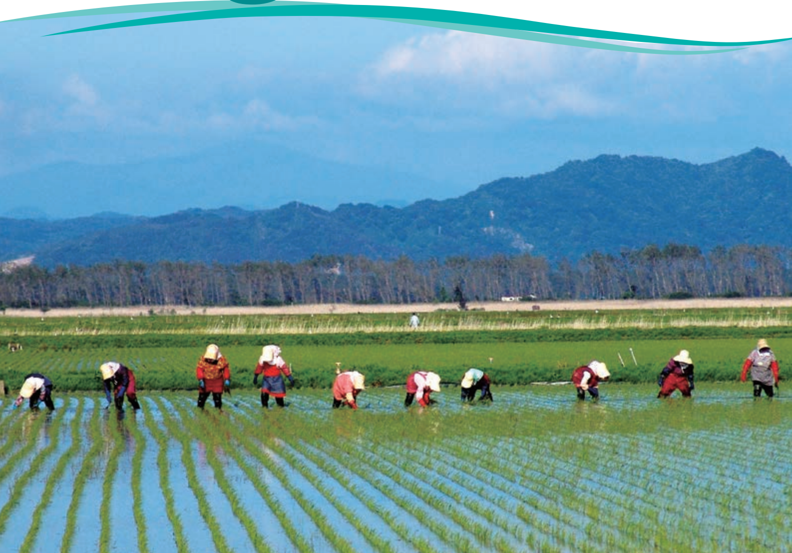
田んぼの草取り作業 昭和55年（1980年）頃 6月