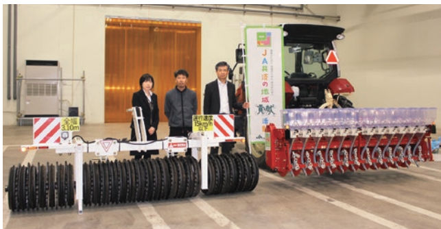
写真右からJA藤原常務、菅野会長、北嶋共済課長