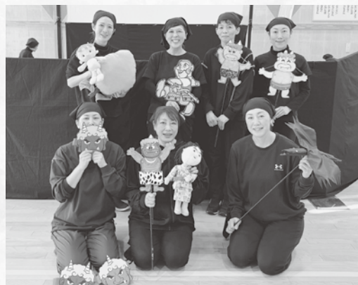
人形劇ボランティア「ももたろう」