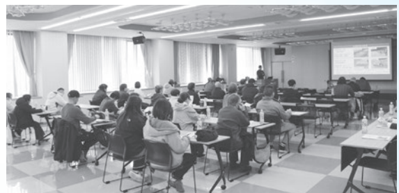
水稻育苗講習会の様子

水稻育苗講習会と座談会の動画をJ Aホームページ「組合員動画(各種研修会動画)」ページにアップしましたのでぜひご覧ください。(組合員専用ページです。視聴の際はユーザー名とパスワードの入力が必要となりますので、ご不明の方は、お手数ではございますが審査課までお越しくださいますようお願いいたします。)